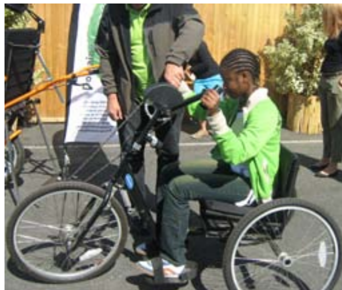
Les visiteurs ont eu l'occasion d'essayer le handbike.

Conférences, tables rondes, et démonstrations de handibikes pour les personnes à mobilité réduite ont ponctué la journée.