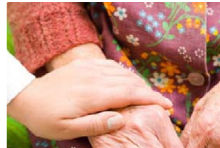
La création d'un service à la personne, un projet ambitieux et solidaire où l'humain est au cœur de nos préoccupations.

Par ailleurs, plusieurs véhicules adaptés (transport PMR) sont disponibles à la location. Grâce à notre partenaire Equip'mobility, il est maintenant possible de louer à des tarifs intéressants des véhicules permettant le transport de un à cinq fauteuils. N'hésitez pas à nous consulter pour plus d'informations ( info@equip-raid.com ).