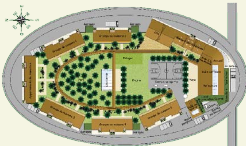
Plan de masse du éco-hameau (plan non contractuel)