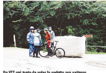
Un VTT qui tente de voler la vedette aux voitures.