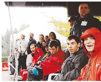
Grâce à la structure, des amateurs de rallye handicapés ont pu voir de près les passages de Sébastien Loeb et des autres concurrents.