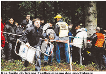
Pas facile de freiner l'enthousiasme des spectateurs.

Le rallye de France-Alsace 2010 faisait, hier, étape dans la vallée de la Bruche avec la "spéciale" Salm entre Plaine, La Broque et Grandfontaine. Zoom sur le virage des Quelles. Du grand spectacle!