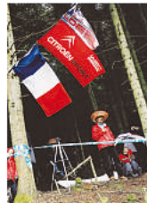
Un supporter de Sébastien Loeb.