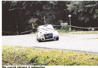
Un sacré virage à négocier.