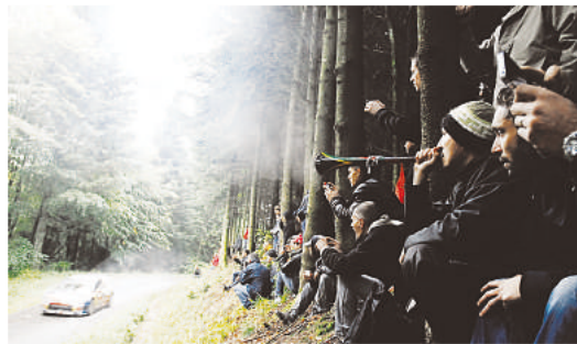
C'était la grande foule dans la forêt vosgienne.

Savez-vous à quel on reconnaît un supporter de Sébastien Loeb? Il porte un sombrero. Une touche excentrique qui ajoutait à l'ambiance multiculturelle observée hier aux Quelles. David Geiss