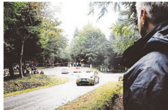
L'asphalte sous la pluie, gare à la chaussée glissante!