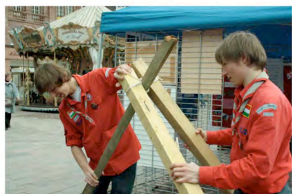
Stand des Scouts ( http://5emulhouse.online.fr )