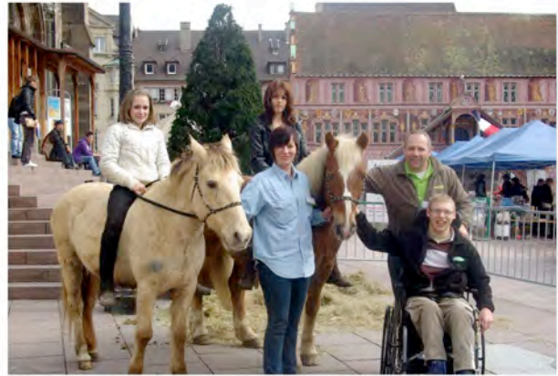
Association Alsace Adventure Horse