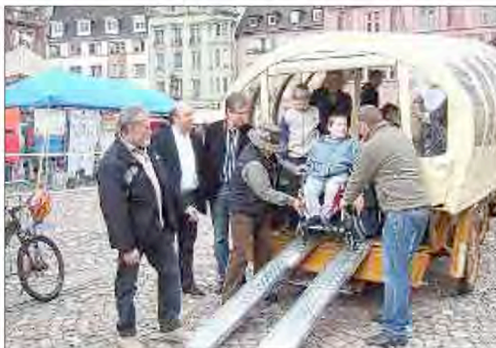
Les représentants de la Fondation Ronald Mac Donald ont remis une calèche équipée aux responsables de Domaine Nature.

Une partie musicale était proposée par différentes associations mulhousiennes, avec comme ob-