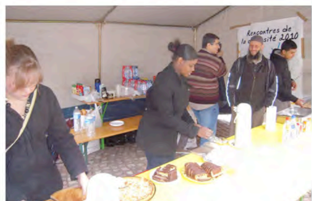
Stand de l'association La Ruche