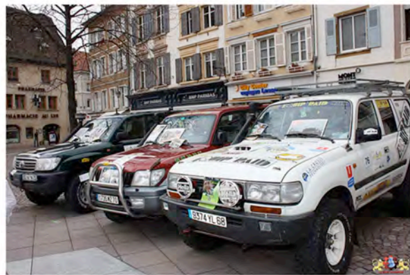
Stand Handicaps Sports Aventures - Exposition de 4x4 équipés grand raid