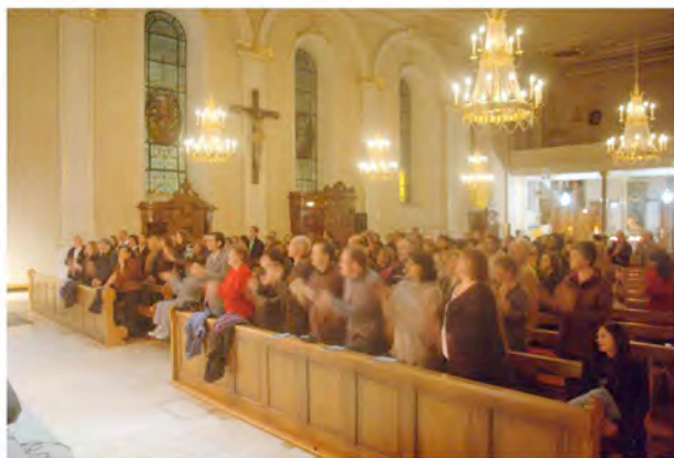
Public du concert des New Gospel Voices