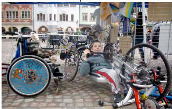
Association Sport Fauteuil