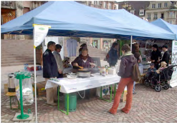
Le stand de crêpes Domaine Nature