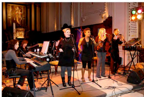
Les New Gospel Voices (NGV)