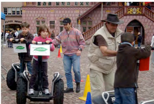
Ecole de conduite segway