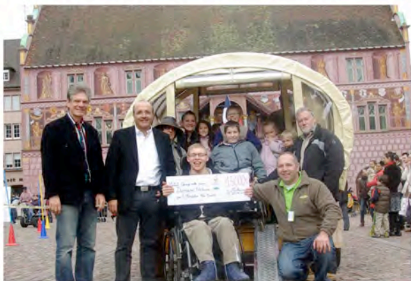
Don de 15 000 € de la fondation Ronald Mac Donald pour Domaine Nature

Retrouvez plus de photos sur www.domainenature.org ou sur http://picasaweb.google.com/adventures.days/RencontresDeLaDiversite2010?feat=directlink